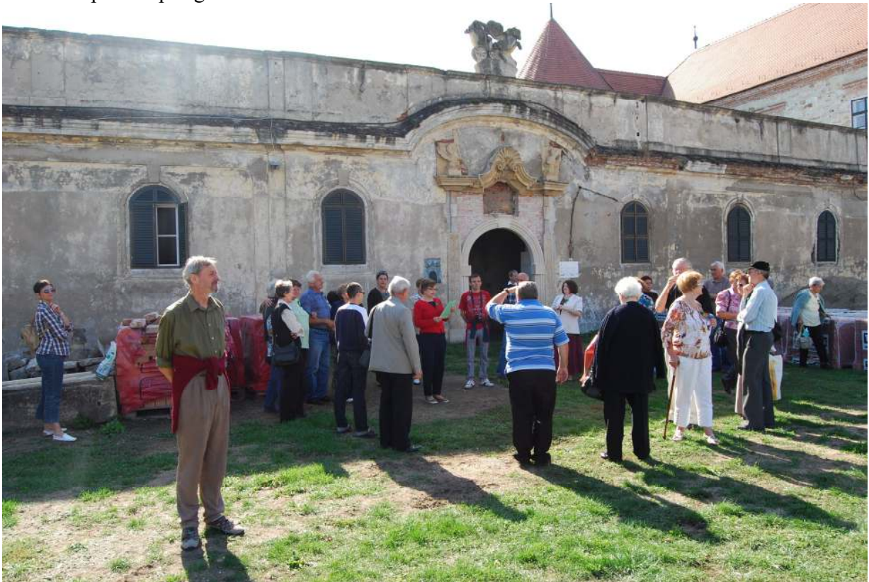
Surfote: Ekskurso al la kastelo

Ni vizitis la Armeni-Katolikan Katedralon , kies konstruado finiĝis en la jaro 1804. Tiam la maljunuloj de la urbo decidis serĉi belan pentraĵon por la altaro. La tiamaj armenoj estis riĉaj kaj ili ofte pruntedonis monon al la aŭstra imperiestro. Kiel danko, Francisko la Unua invitis ilin elekti pentraĵon el la imperiaj galerioj de Vieno. La armenoj elektis La malsuprenirigo de Jesuo de super la Kruco de Peter Paul Rubens, grandega pentraĵo, tamen tro malgranda por la altaro. Kvankam la pentraĵo valoras milionojn da dolaroj, oni povas vidi ĝin senpage en aparta kapelo konstruita speciale por ĝi.