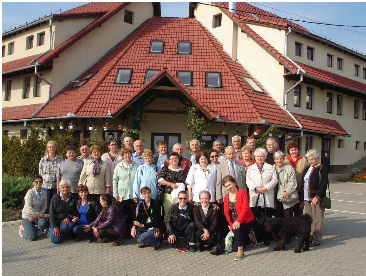
Surfote: Komuna foto

En la jaro 1944 la germana armeo evakuis la proprietulojn, por uzi la kastelon kiel militan hospitalon. La konstruaĵo estis serioze damaĝita fine de la dua mondmilito, kiam la retiriĝintaj germanaj trupoj atakis, rabis kaj bruligis la tutan ensemblon. Estis detruitaj la tuta meblaro, pinakoteko, la konata portretgalerio kaj la biblioteko.