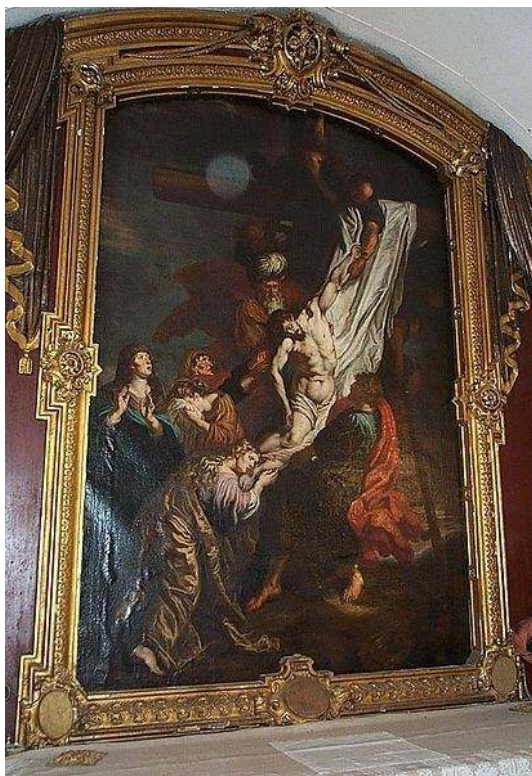
La malsuprenirigo de Jesuo de super la Kruco de Peter Paul Rubens